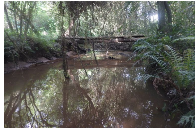
Imagem atual do Arroio Noque em área próxima à escola Franke. No local há entrada de esgoto, por isso tem mau cheiro, a mata ciliar está bastante comprometida devido ao corte, ao uso inadequado pelos moradores locais e pela criação de animais.

Nós somos a Turma 41 da E.M.E.F. Carlos Oswin Franke, de Portão/RS.