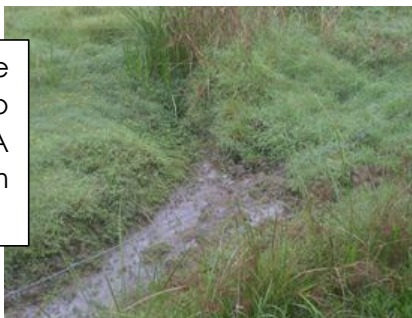
Foto da nascente do Arroio Noque feita durante o passeio investigativo de Turma 41 da Escola Franke. A água com aspecto limpo e sem cheiro, brotando da terra.

“Nasce próximo à divisa de Portão e Capela de Santana. Atravessa a zona central de Portão e desemboca no arroio Portão, no final da Vila Trilhos na rua São Pedro. É o afluente mais poluído, por receber o esgoto cloacal do Hospital de Portão. Joga-se lixo diretamente no arroio e há a extração de areia do leito deste arroio em alguns trechos. Percorre aproximadamente 9,2 Km de extensão.” (Texto do livro Conhecer para amar e respeitar a nossa história, p. 22. Prefeitura Municipal de Portão).